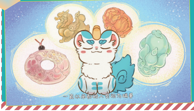
一窝神兽的打工生活