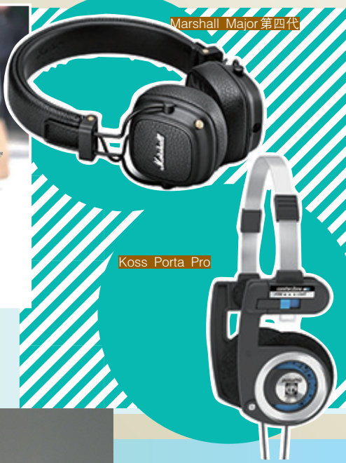
Koss Porta Pro