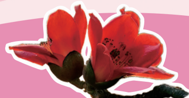
陵园西路/广州起义烈士陵园