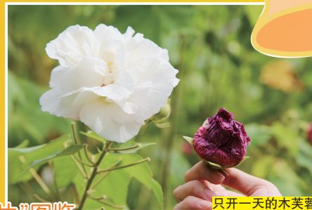
只开一天的木芙蓉

“捡秋”就好似一场游戏,我们根据地图和路牌的指引去到树下,地上五颜六色的落叶、落花和果实等都是秋天的“碎片”,半天就能收获“大满贯”。“碎片”这么多,我们要怎么选? 树上叶子依然青绿,但地上的落叶有鲜红色、黄绿色、橙棕色、深棕色,它们可以帮你“还原”秋色;南洋杉的叶子细长如针,芭蕉树的叶巨大如掌,木芙蓉的叶形似枫叶,形状各异的落叶,描绘秋天婀娜多姿的轮廓。在“捡秋”时,落花不再是写满凋谢的伤感,而係秋色中一抹艳丽的色彩。不过,要扒到靓的落花有难度,首先要撞到花期在秋冬季节的花,比如粉紫色的异木棉、深红色的木芙蓉。秋天是收获的季节,但在城中,要捕获成熟掉落的野生果实,真係要花啲心机。搵一啲树木比较密集的小路逛下,在草丛中细心翻找会有惊喜,有网友就找到了人面子、木麻黄、青梅等果实,最难得的要数小巧精致的松子。要提醒下大家,“捡秋”唔係“剪秋”,千祈唔好伤害啲植物。