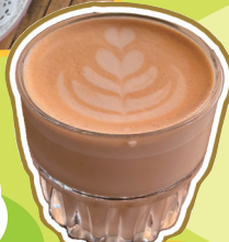
沐村南非红茶拿铁