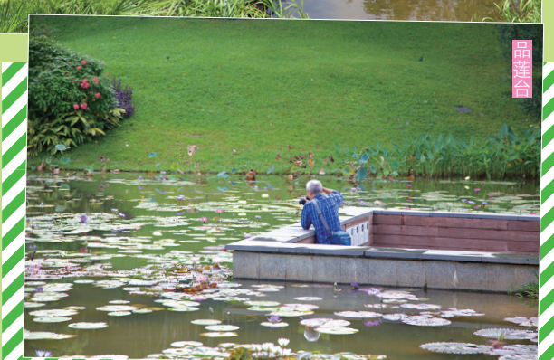
绿植环绕随手出片

园内一步一景，抬头蓝天白云，低头各式珍稀植物和绿油油的草坪。睇咗咁般蜿蜒的虹桥、云桥上远望山谷，你会见到城市同自然和谐相接。听住旁边传来的潺潺流水声，有如沐浴在天然氧吧中，心情都靓晒。植物园还专门设置了一些有意思的打卡点：流光溢彩的巨型彩蛋、环抱榕树而建的走廊、大片的露营地等。“花城艺术馆”係出大片嘅绝佳位置，从艺术馆旁边二楼下拍，大树树荫庇护配上充满童年回忆的秋千，即可获得一辑人生大片。植物园内超大嘅草坪露营地，已经摆好天幕同小枱凳，方便你拍露营野餐大片，又或者坐低同朋友聊聊天，一起感受“公园20分钟效应”。