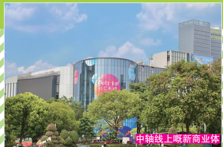
中轴线上最新商业体

为加快发展新质生产力，打造黄埔区“三城一岛”产业增长极，科学城扛起“智造强芯”大旗，作为人才“蓄水池”，持续塑造“有山有水有风光、生产生活有生态”嘅超级城市会客厅。科学城从通勤落手，改造开泰大道、开创大道，上线6条地铁接驳专线，实现科学城站、萝岗换乘中心与珠江新城、黄埔港、琶洲嘅30分钟通勤圈，让年轻人跨区出游成为日常。片区内即将解锁“15分钟步行圈”，学校、医疗、文化、生活服务、运动场地触手可及。新增环山步道和智能天桥，让通勤路秒变山景打卡位。五星购物中心和高端写字楼一体嘅新地标纷至而至，落班直奔网红餐厅、打卡广州首店即将成为现实。拔地而起嘅高楼和不远处嘅自然山水相得益彰，让科学城又成了广州嘅“城市封面”。