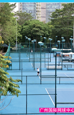
广州国际网球中心