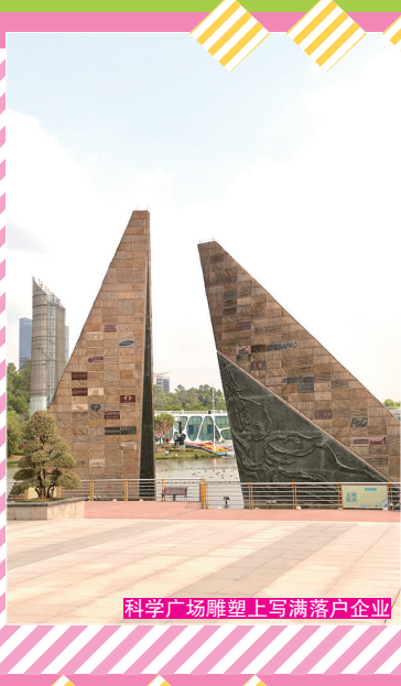
科学广场雕塑上写满落户企业

在2011年评选嘅“羊城八景”中，最硬核既存在当属黄埔科学城。作为科创绿洲，这里科技、生态元素含量超高，从建设新地标，到升级生活配套，科学城正在加大声量，吸引更多“想搞点大事”嘅年轻人，为佢哋建造一方“神仙打架”嘅舞台。可乐君马上带大家解锁这个软硬兼备嘅“双面之城”，快跟上！