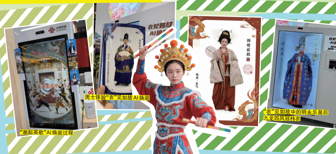
“潮起英歌”AI换装过程

每次入行古色古香嘅博物馆,个心就罗罗拳,想影返咗古风写真。依家有咗AI算法,一块屏幕就可以搞掂!睇中国国家博物馆,“衣”见如故嘅AI换装相机,帮你秒get皇后娘娘同款写真。这部换装相机收录从西汉到明朝嘅经典造型,明永乐皇后九龙四凤冠袂衣博物馆的“限定款”。“咔嚓”一声,顶流藏品“九龙四凤冠”就“戴”上身,仲会生成你行礼摆pose嘅视频。男仔仲有专场——一套套古代官服嘅公服或道袍,睇下自己“上朝堂”嘅look几chok!其实佢係通过采集面部特征,用AI算法“换面”,虽然成片未必似本人,但个样同表情绝对够靚。呢种男女老少都like嘅换装相机,嘅好多地方可以见到,佢仲会加入当地特色元素,成为“到此一游”嘅最佳纪念。譬如汕头的潮起英歌·AI数字空间体验馆,影张相等3秒,你就可以变身英歌舞嘅唔同角色。都话人靠衣装,先进嘅技术搭配上老祖宗嘅顶级审美,就算“到此一游”游客向都可以出片,让你成为朋友圈焦点。