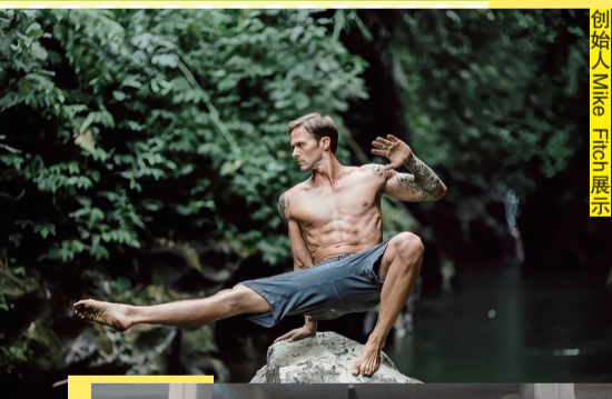
动物流在热身环节使用