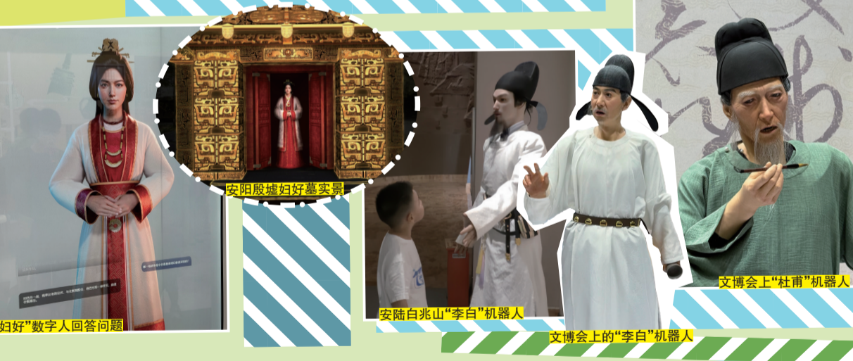
“妇好”数字人回答问题

近排,李白、苏东坡这些名家化身“时空版KOL”,睇视频中边讲英文边为各地景区代言,跨越时空,直击人心。想知道佢哋八卦?不如去同“古人”面对面倾计。睇李白故乡安陆白兆山,“李白”机器人成为旅游区嘅金牌讲解员,1:1还原嘅“李白”仿生机器人施展“诗仙”功底,陪你吟诗作对,同你爆料李白嘅创作心得、逸闻轶事,虽然表情木讷,但反应够灵活,可以用英文同外国游客对答如流。另一边,三千年前嘅“女战神”妇好化身教智人“妇好”,现身妇好墓所在嘅安阳殷墟。但身着高代华服,一眼就知身份尊贵,作为拥有“王后”“女将军”“祭司”等多重身份嘅女性,带你回顾一场难忘嘅战争。教你如何身兼多职仍然保持情绪稳定,更会话你知商代边度有烟火气。借助AI大模型嘅实力、机器人等智能硬件嘅硬科技,让越来越多“老祖宗”富有个性、有智慧,同后人分享佢哋嘅所见所闻。