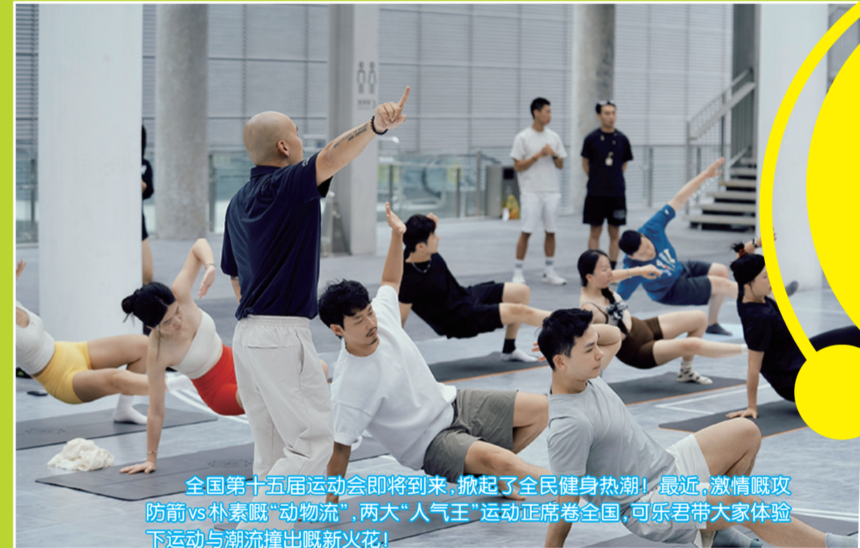
全国第十五届运动会即将到来,掀起了全民健身热潮!最近,激情攻防箭vs朴素“动物流”,两大“人气王”运动正席卷全国,可尔君带大家体验下运动与潮流撞出嘅新火花!