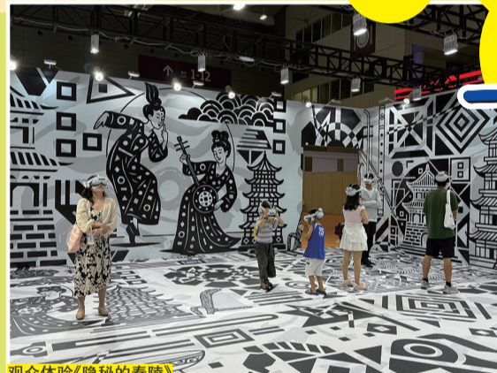
观众体验《神秘的秦陵》

在国家典藏博物馆里,如果见到有人头戴“头盔”,凭空摸索,千祈唔好觉得奇怪——但咁正通过“时光隧道”,“穿越”到山西永乐宫嘅元朝壁画中。入行限时VR展“幻游永乐”,“人在画中行”成为现实。你可以骑着青龙游山玩水,跟住“吕洞宾”体验“神仙视角”,身体伸会因模拟嘅失重感而轻轻摇晃。靠VR大空间技术和3D建模技术,博物馆参观开启“历史文化元宇宙”新赛道。其中,XR影片《神秘的秦陵》已经睇各大博物馆巡展,20年来嘅“寻秦”成果汇集成“秦朝元宇宙”,打卡千年秦陵地宫,同逼真兵马俑“面对面”!广东亦有专属嘅“元宇宙”——《广府梦华录》数字文化展,睇广东海上丝绸之路博物馆可以睇到。同好朋友手牵手踏上“南海一号”,“返到”千年前嘅岐山渡口,帮衬下路边小贩,把玩象牙盒、丝绸扇等珍品,见证千年商埠广州嘅繁华。当千年前嘅生活场景清清楚楚摆在眼前,让人不自觉为呢片大地上嘅历史文化感到骄傲。