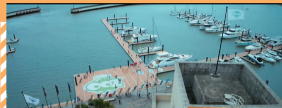
南沙游艇会(《熊出没》电影中的镜头)