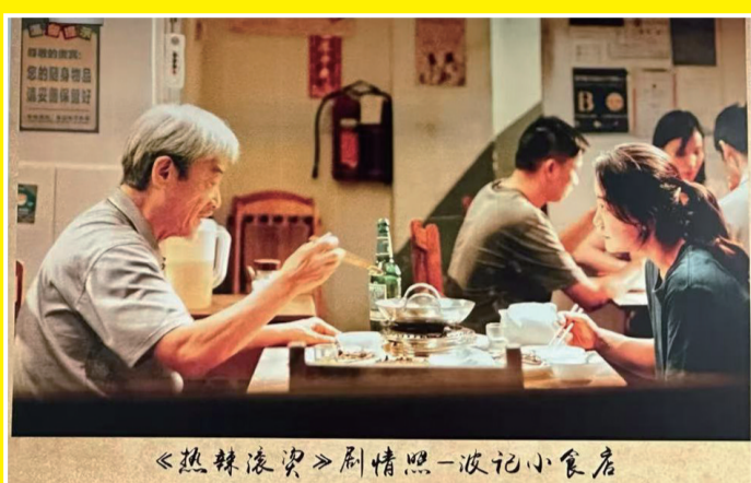
《热辣滚烫》剧情照-波记小食店