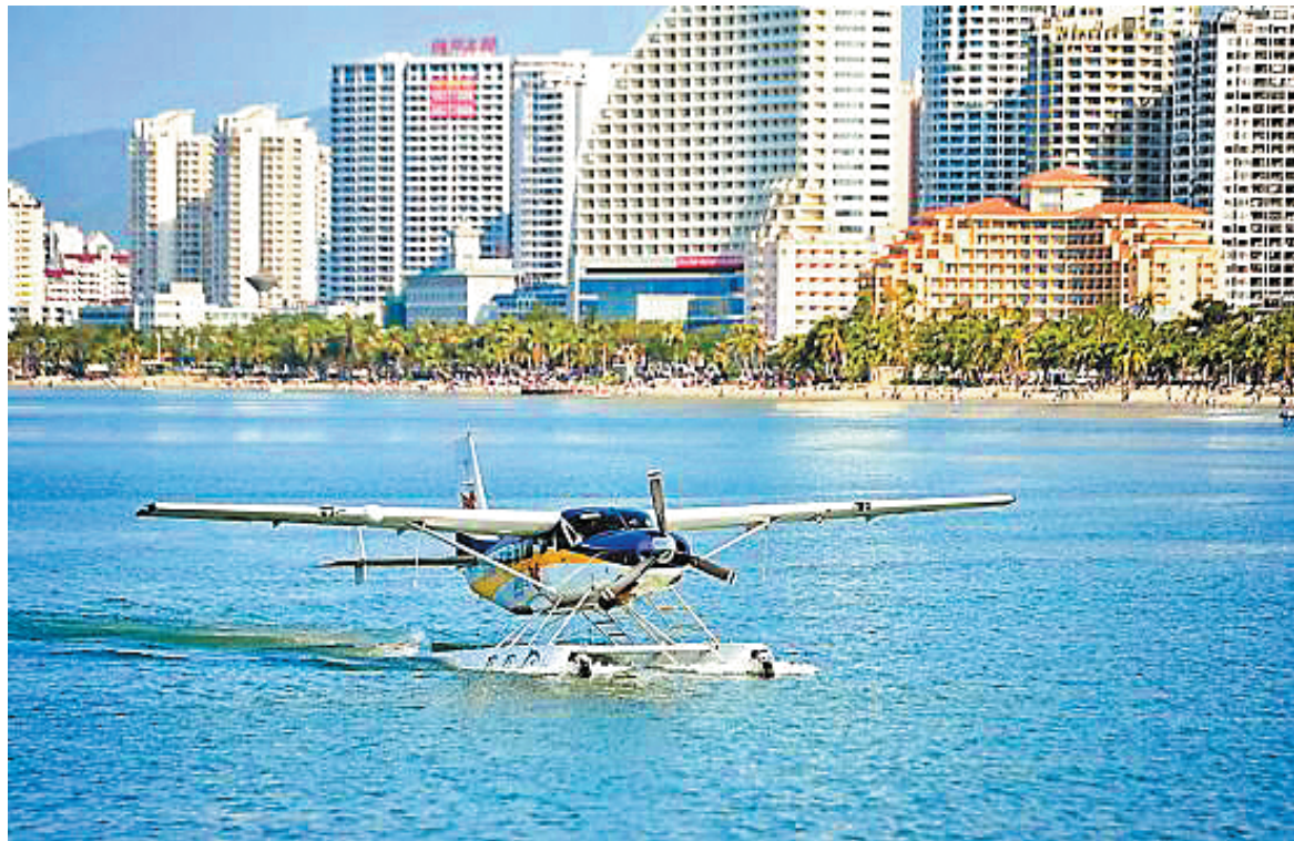
国际旅游消费中心先行区的三亚市