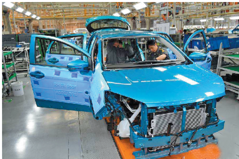
福建加速发展新能源汽车产业