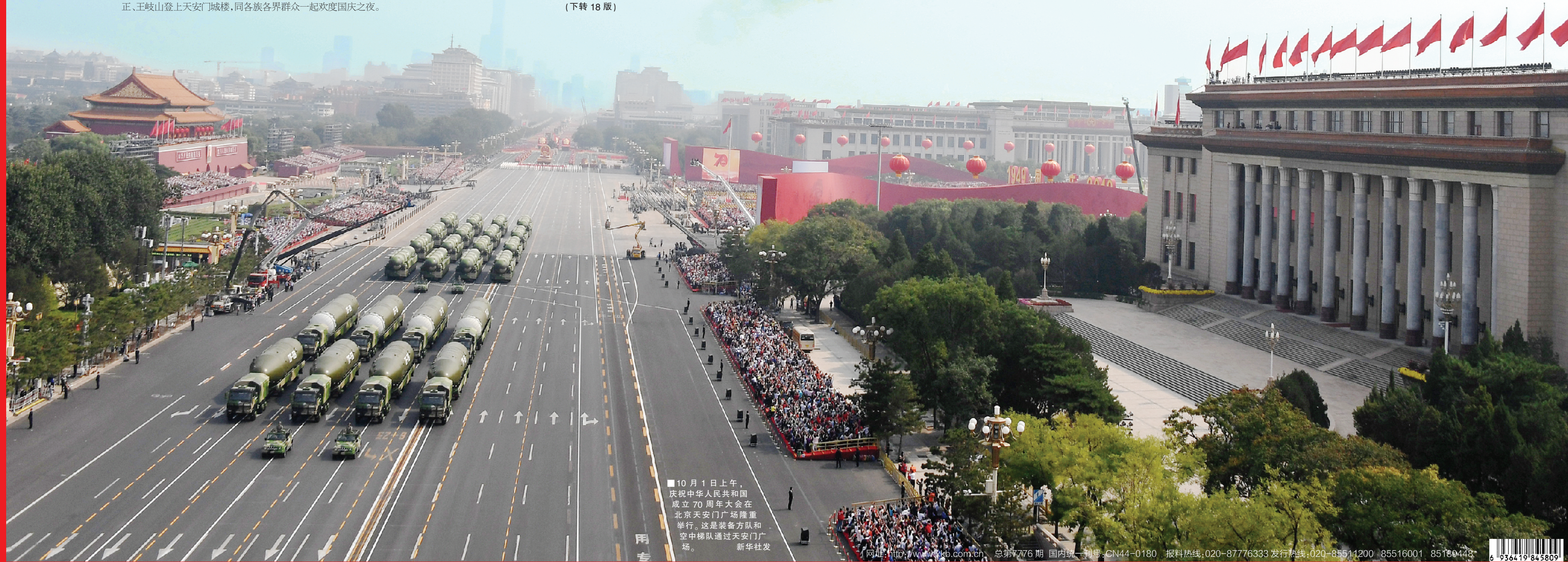
■10月1日上午，庆祝中华人民共和国成立70周年大会在北京天安门广场隆重举行。这是装备方队和空中梯队通过天安门广场。新华社发