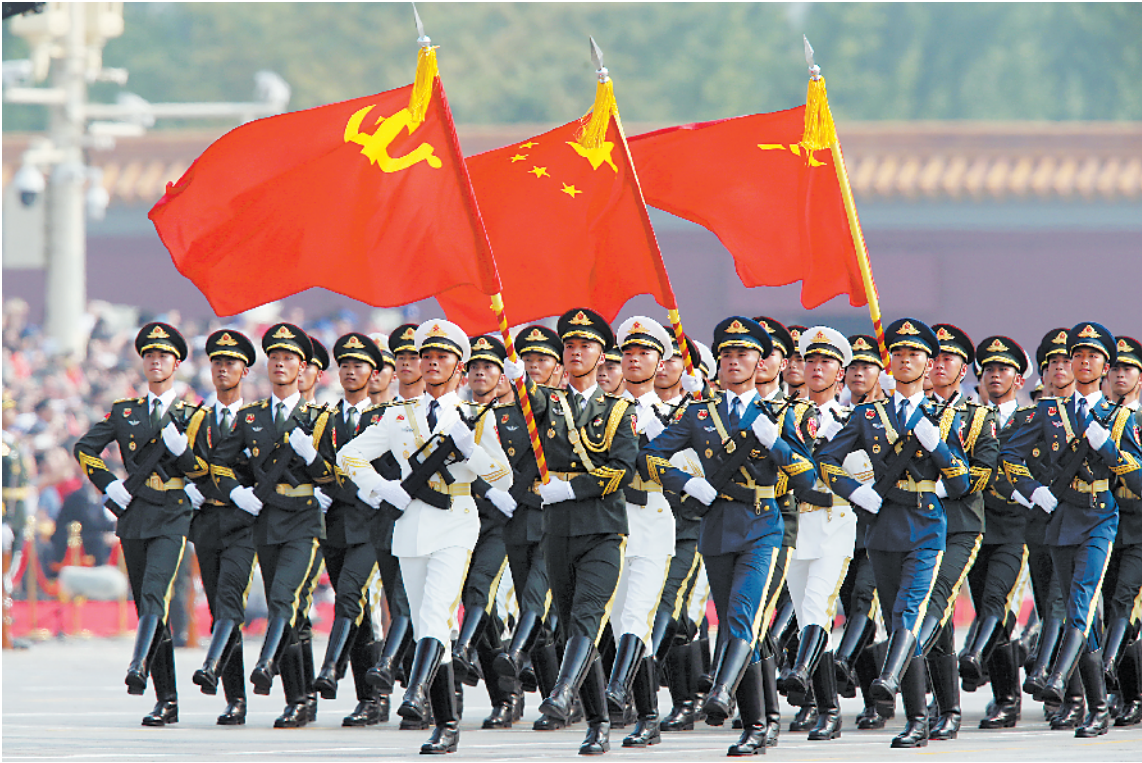
■这是仪仗方队首次同时高擎党旗国旗军旗经过天安门接受检阅。