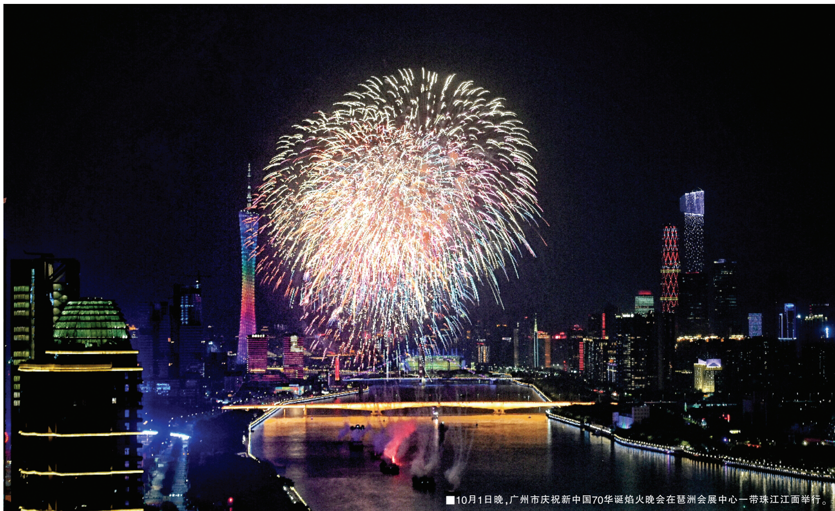
■10月1日晚,广州市庆祝新中国70华诞焰火晚会在琶洲会展中心一带珠江江面举行。

昨晚,珠江两岸,焰火璀璨。由广州市委、广州市政府主办的广州市庆祝新中国70华诞焰火晚会在珠江广州市区河段琶洲会展中心对出江面举行。花城上空绚烂烟花随着音乐盛情绽放,广州用最璀璨的礼花为祖国母亲献礼。本次焰火晚会以“讴歌新时代,共圆中国梦”为主题。珠江水面上,4艘燃放船与5个燃放浮台呈一字排开,打造宽1200米、高300米的壮丽焰火画面,共有13.8万发焰火伴随着音乐绽放,整个过程历时25分钟。