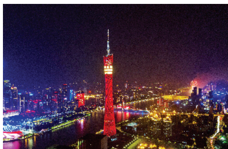
■广州塔“身披红妆”庆国庆。