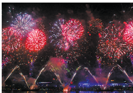
■焰火绽放,气氛热烈。