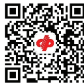
广东省福利彩票发行中心公众号