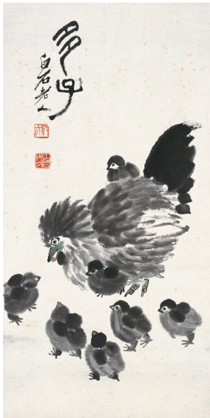
■齐白石笔下的十二生肖(部分)。