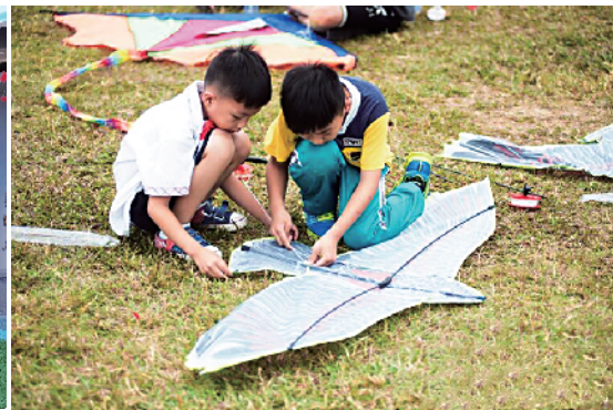
■阳江风筝形美质佳易放飞。