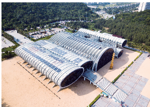
■海陵岛南海一号。

到海陵岛除了看海玩海,最不可错过的一定是南海一号。这艘南宋时期的木质商船1987年在阳江海域被发现,也是国内发现的第一个沉船遗址,它长约30米,宽10米,800年前承载着数万件德化窑、磁灶窑、景德镇窑、龙泉窑系的精品和其他文物长眠于南海。现在,它藏于极具现代感的波浪造型“水晶”建筑之中,内里的珍藏品让人大饱眼福的同时还可以近距离观看考古人员提取文物的现场过程。