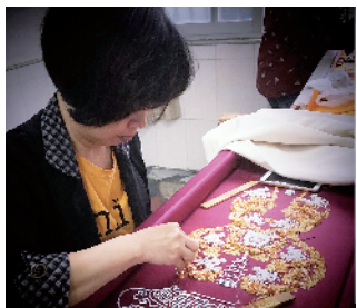
■妇女靠潮绣可以维持生计。

种类不再局限于高端的收藏品,而是使衣服、包包、鞋子、家居装饰等都成为了潮绣“新”元素,例如潮绣嫁衣现在也成为很多年轻人结婚的标配服饰。要知道,潮绣嫁衣在过去只是流传于潮汕地区的一种独特情感传递方式,很多嫁衣都是世代相传,由母亲年轻时出嫁时穿过就收藏好,等自己女儿出嫁时再拿出来让女儿穿,但时至今日,潮州绣娘手中的那一根神奇秀针,也为我们带来了更有质感的人生。