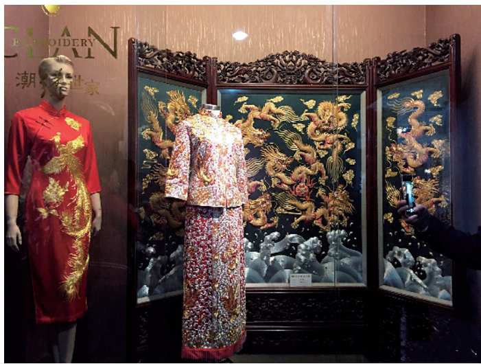
■潮绣嫁衣现在也成为很多年轻人结婚的标配服饰。