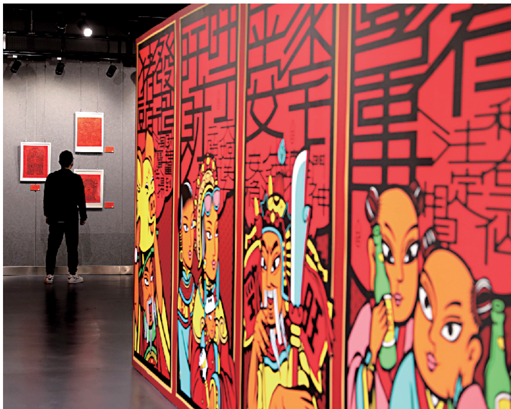
■“福牛贺岁 年画呈祥——佛山解忧年画铺 2021 新春展”展出大量佛山冯氏世家的传统木版年画作品。

针对冬春疫情防控情况,广州各公共场馆将采取限量、预约、错峰入馆等措施,市民要提前做好安排。