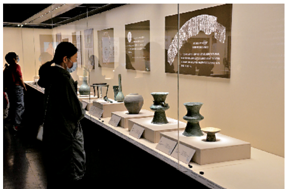
■西汉南越王博物馆《滇王与南越王》展览为观众重构两千多年前两个地方王国的历史图景。

南汉二陵博物馆还将组织“公众考古体验探索营”,邀请观众一起走进奇妙的考古世界,探索淹没的神秘历史,更有翻模、拓印等体验活动。