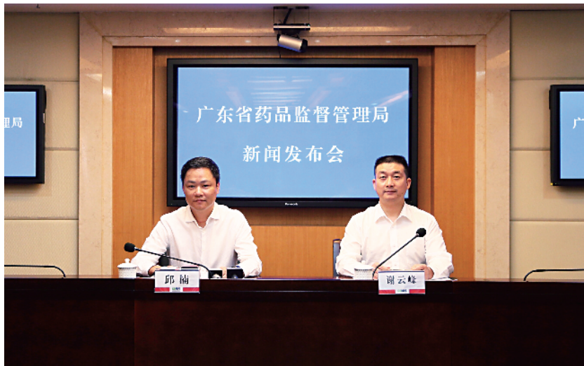
■2月4日,广东省药品监督管理局召开例行新闻发布会。

化妆品抽检4380批次,完成检验4350批次,合格率96.16%。其中,网络抽检290批次,重点对面膜类、美白类及祛痘类等网红产品的抽检,合格率91.03%。不合格项目主要为检出成分与批件(标签标识)不符、重金属超标、微生物指标等。