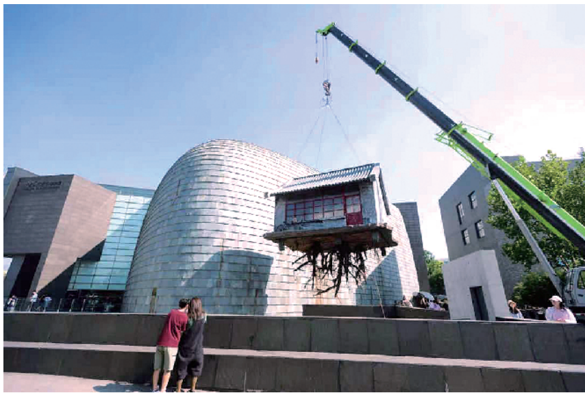
■《连根拔起》2015年中央美术学院美术馆展览现场。