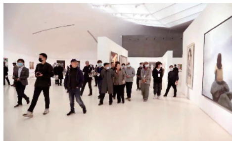
■2021年3月25日，“功夫——造型学科基础部成立二十周年展”在中央美术学院美术馆现场。