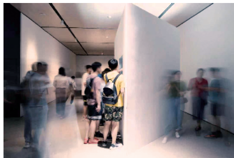
■《迷失花园》，2009年，中央美术学院美术馆展览现场。