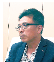
刘小东 全国政协委员 中央美术学院教授