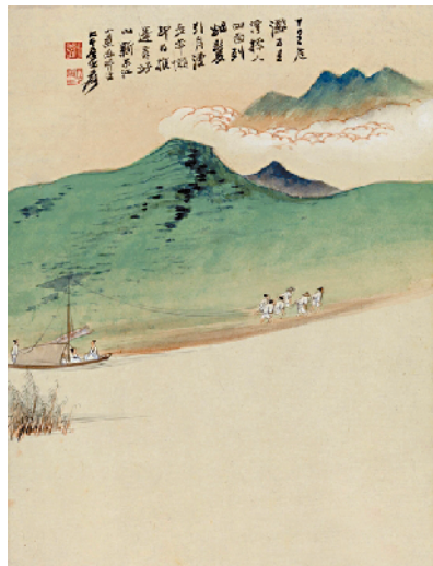
■张大千 山水册页之六十:里危滩五里湾 中国美术馆藏