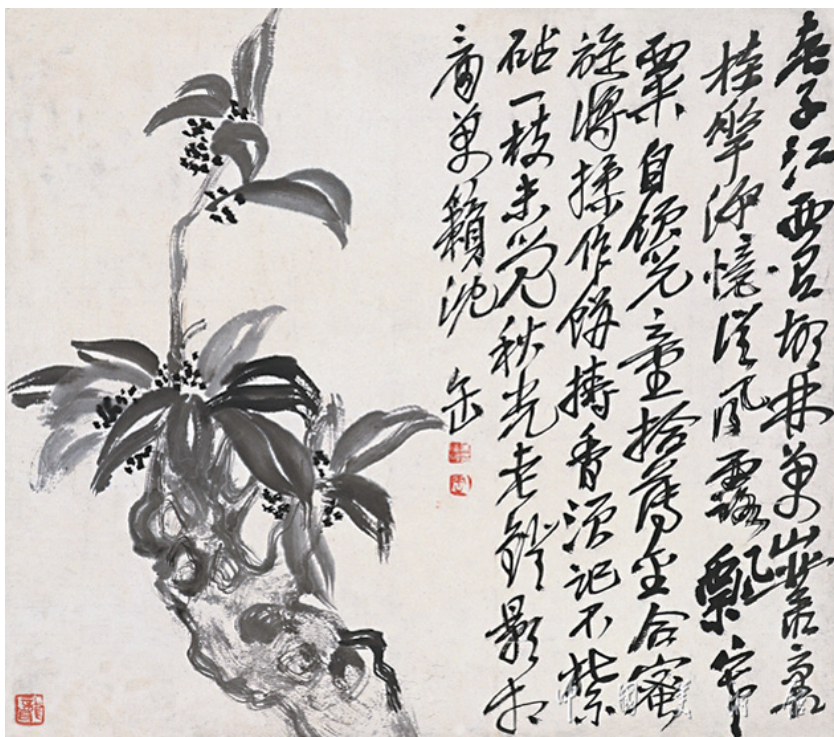
■吴昌硕 桂花 中国美术馆藏