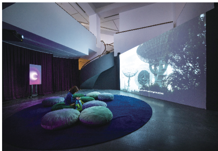
■交融的激流:广州影像三年展 2021 展览现场