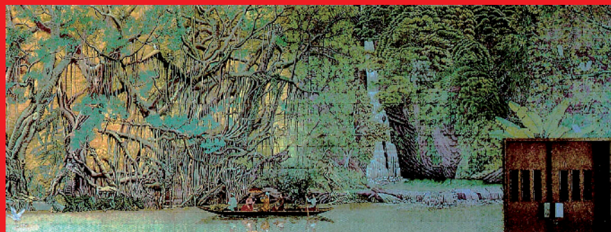
►祝大年先生1979年为首都国际机场创作的壁画《森林之歌》,强调了中正平和的审美观,至今看来仍不失为了一件公共艺术的精品力作。