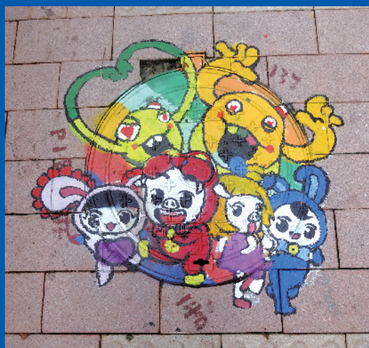
▲广州某区的沙井盖改造《咏声》