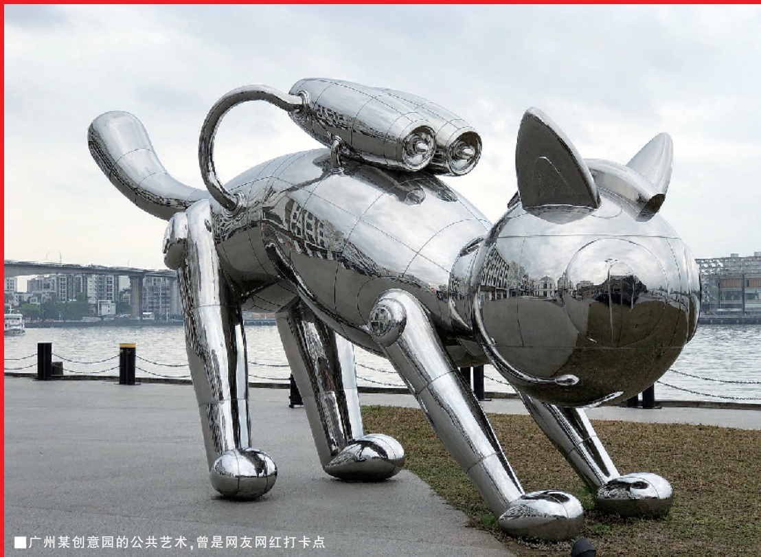
■广州某创意园的公共艺术,曾是网友网红打卡点