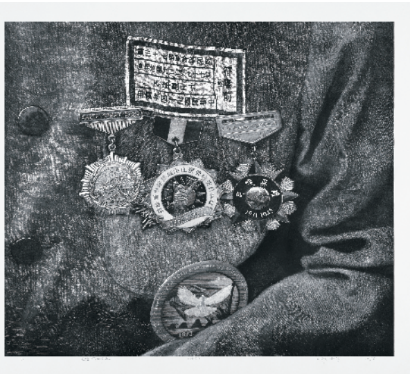
■喻涛、杨琦《见证·热血铸就》版画(黑白木刻) 90×105cm 2019年