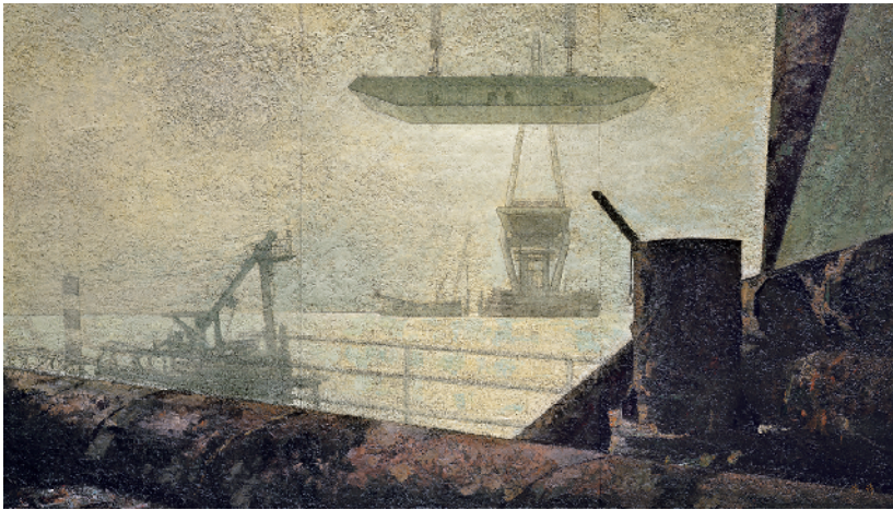
■陈许 海中的构成 (纪念改革开放30周年全国美展优秀作品)

很多人认为,陈许的作品有视觉新意,他的画面特别有绘画感和张力。这与他在追求油画语言的个人品格方面下了很大的功夫有关,他沉迷于研