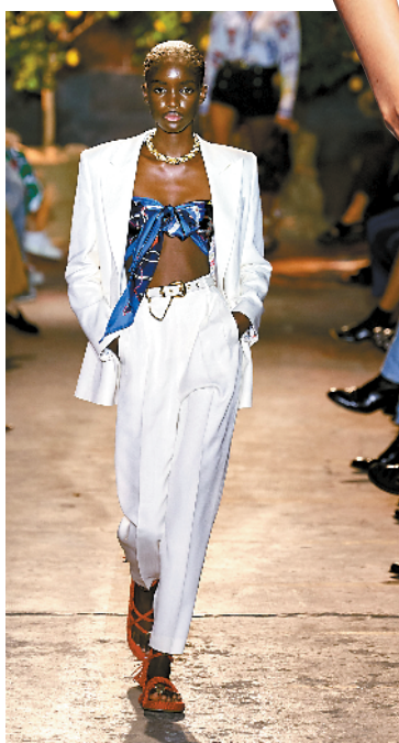
▲长条形丝巾在中间打结,轻松打造出蝴蝶抹胸款式,搭配西装外套,高级感秒出。

选 90×90 厘米大小的方巾更容易系得住,用金属链条辅助能更好定型,还能提亮肤色,避免亮色印花显黑黄。