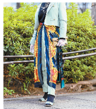
▲将丝巾系在纯色连衣裙或套装上,既可重塑腰线,又能叠穿出层次感,一套新衣 Get!

T恤用别针固定在领子侧面也可以有同样效果,或是拉起T恤一角,用折叠成细长条的印花丝巾绑住,把T恤多余部分藏起来,既能露出美好腰身又能让简单搭配更精彩。