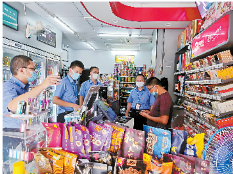
■河源市烟草专卖局执法人员现场调查。