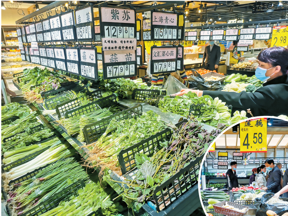
■广州天河区一超市的蔬菜区。