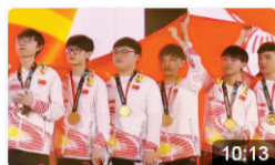
【英雄联盟】电竞成为2022年杭州亚运会正式项目！