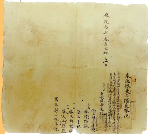
■安南官府地簿,越南,习之堂藏