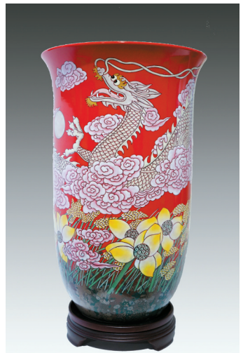
■宁钢《和合》,综合装饰