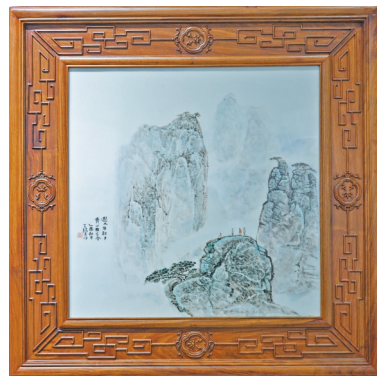
■王锡良《游人自朝夕,青山无古今》,粉彩瓷板画