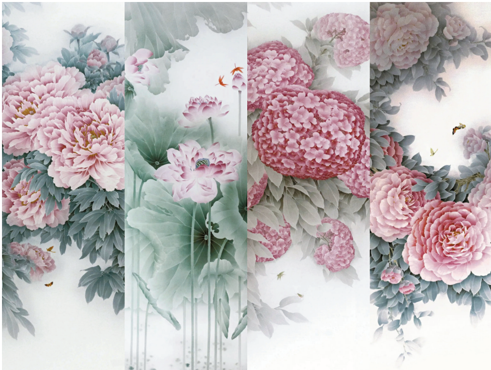
■黄小玲《四季同春》四条屏,醴陵釉下五彩