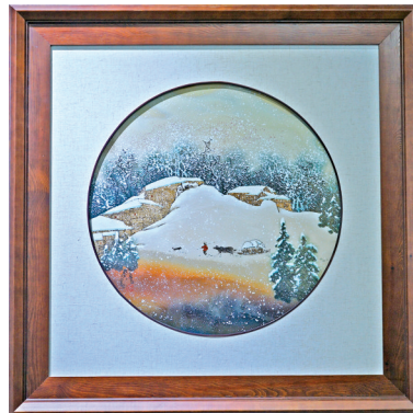
■刘伟《瑞雪兆丰年》,综合装饰,瓷板