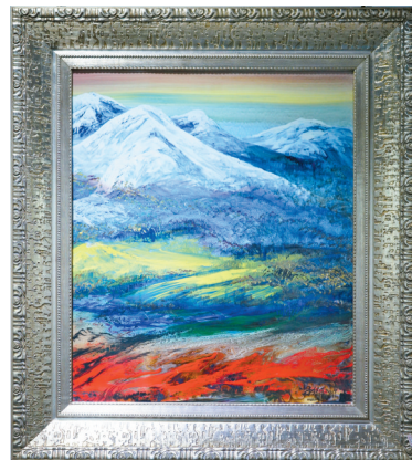
■赖德全《油画风景》,新彩,瓷板