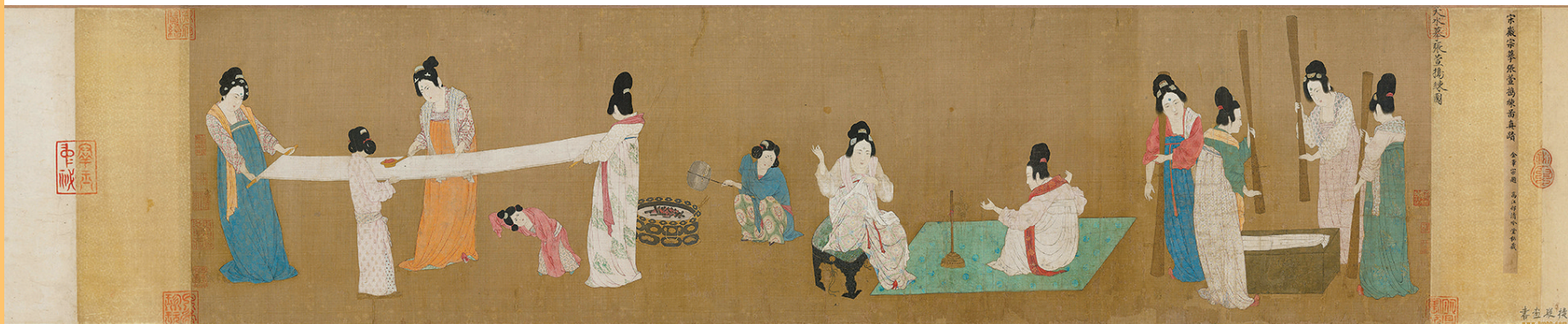
■捣练图 唐代画家张萱