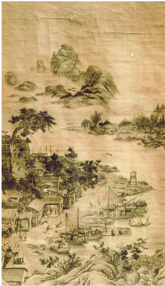
■郎世宁 羊城夜市图

但值得注意的是,画面中男子着装、发式俱为明代造型。大襟、右衽、宽袖,下长过膝、头发以裹巾盘于顶等。画中的桌案、桌腿和桌面平直、有替木牙子、前后直腿之间连以双枰、左右间为单枰,是明代常见的平头案。郎世宁来到中国的时候是清中,而且画作落款年份是乾隆元年即公元1736年。原则上现实不会再有明代生活特征,有研究推测,由于乾隆对汉文化极为欣赏,该画作描写明代场景,有可能只为迎合乾隆。