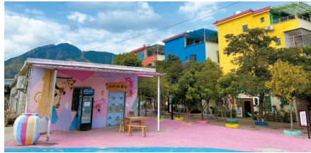
■新桥民宿村干净整洁、美丽宜居的村庄风貌。