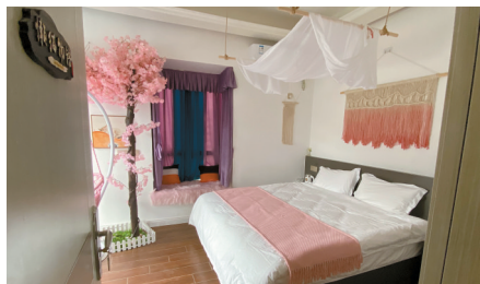
■新桥民宿村里现代简约设计风格的特色民宿。