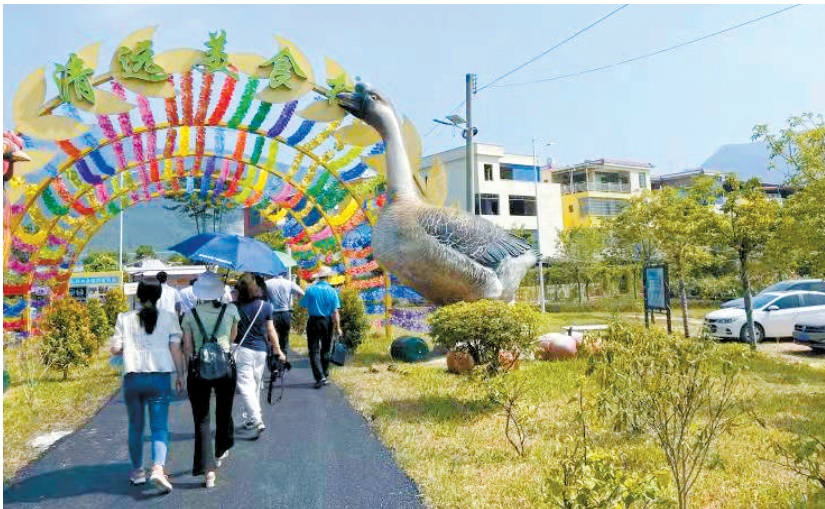
■清远市新桥民宿村。