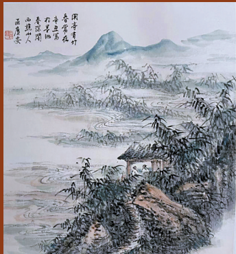
区广安 闲亭有竹春常在