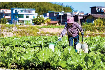
■在大潘村兴建了26亩蔬菜基地,工作队还对接好了销售渠道。