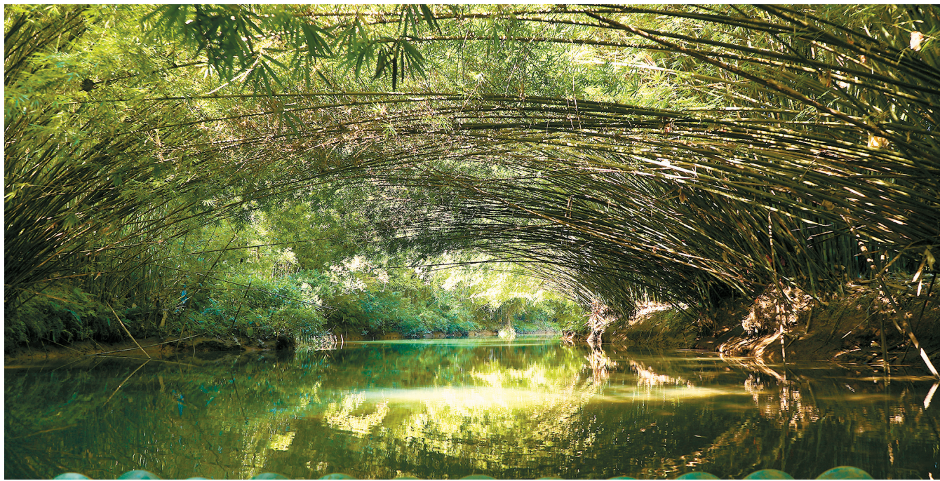
■古水镇拥有良好的自然资源,沿古水河打造的观光旅游线路很受游客喜爱。

古水镇,位于具有“竹林之乡”美誉的广宁县西部、绥江中游,因镇中一衣带水而得名,G355国道穿镇而过,两旁分布着1个社区、14个行政村。有得天独厚的自然资源打底,古水镇在广宁县委县政府、驻镇帮扶工作队等共同努力下,将构建“一链九品美食厂,乡村旅游三景区”的古水乡村振兴总格局,充分利用古水河优势,将自然风光与人文景致相结合,推进广宁县全域“康养+旅游+乡村振兴”融合发展新模式。