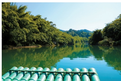
■大潘村的古水河旅游项目已开始试运营,不到一个月已经开始盈利。