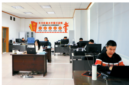
■工作队进驻后短时间内就完成了对古水镇15个村居的走访调研。