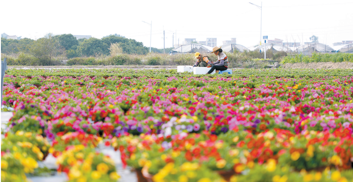
■水天农艺占地约420亩,种植有彩椒、台湾香水莲、红掌、口红花等,全年产值达1800多万元,解决了当地50多户人口就业。

记者了解到,目前,花都区花卉苗木种植面积超8万亩,现有花卉企业455家,包括8家龙头企业、40多家大中型企业,花卉种植面积、产值分别占广州市的26%和38%。目前已初步建成逸翠园、叶海生态园等一批花卉盆景现代农业生态园区,蝴蝶兰、大花蕙兰、凤梨和红掌等产品更是闻名全国。