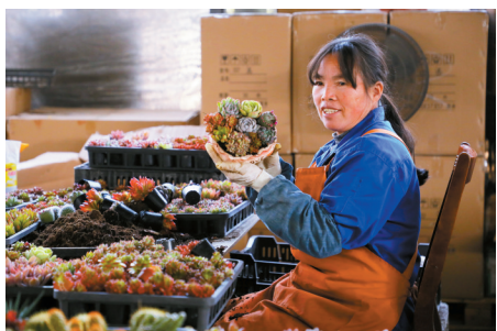
■工人对多种多肉植物进行整合装饰。