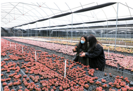
■游客在朝辉农业花卉大棚内挑选多肉盆栽。