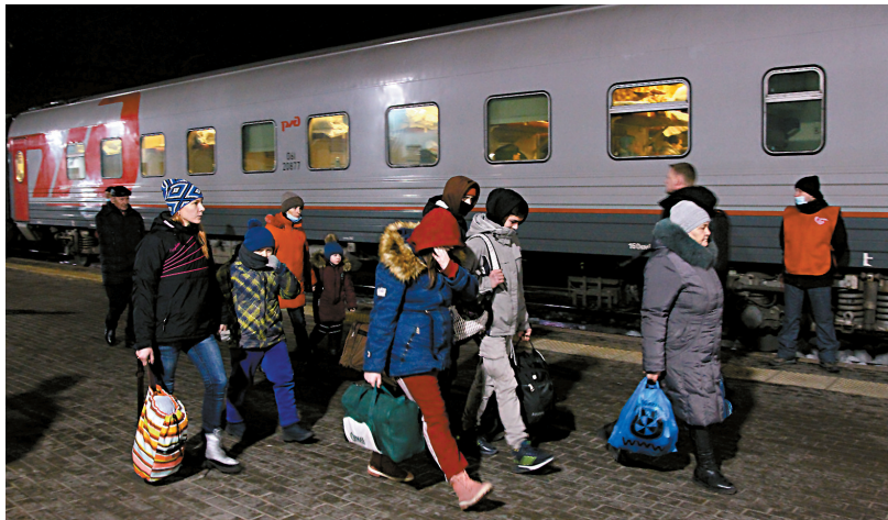
■2月22日,来自乌克兰东部的难民乘坐火车抵达俄罗斯下诺夫哥罗德。

他建议紧急召开“诺曼底模式”四方峰会,并保证乌方将致力于政治和外交途径解决冲突,但不会屈服于挑衅。