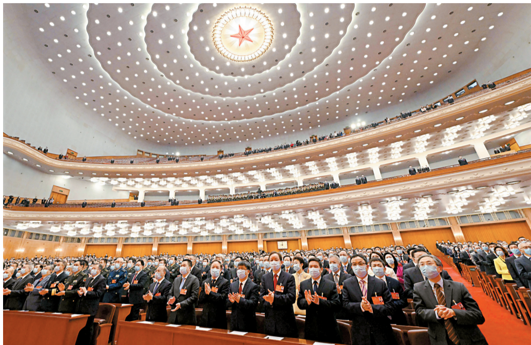
■3月10日,中国人民政治协商会议第十三届全国委员会第五次会议在北京人民大会堂闭幕。

汪洋在讲话中说,这次会议广泛汇聚正能量,开出满满精气神,是一次高举旗帜、民主团结、求真务实、简约高效的大会。中共中央总书记、国家主席、中央军委主席习近平等党和国家领导同志出席大会开幕会和闭幕会,深入界别小组听取意见,与委员共商国是。全体委员认真讨论政府工作报告和其他报告,审议全国政协常委会工作报告等文件,围绕党和国家中心工作深入协商议政。委员们一致表示,要深刻领悟“两个确立”