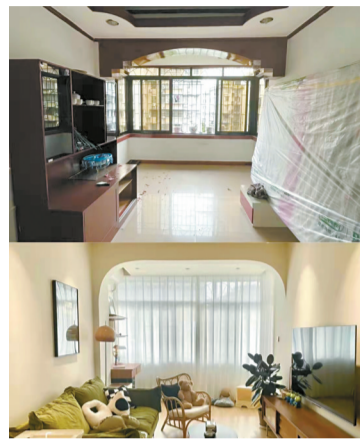
■客厅改造前后对比。