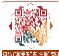
扫码了解更多“家·生活”资讯

面橱柜,增加收纳空间。同时,采用嵌入式设计把家用电器放置在角落或者畸形的地方,避免各种家具堆叠,尽量在空间上保持整洁干净,视觉上也会更加的美观。