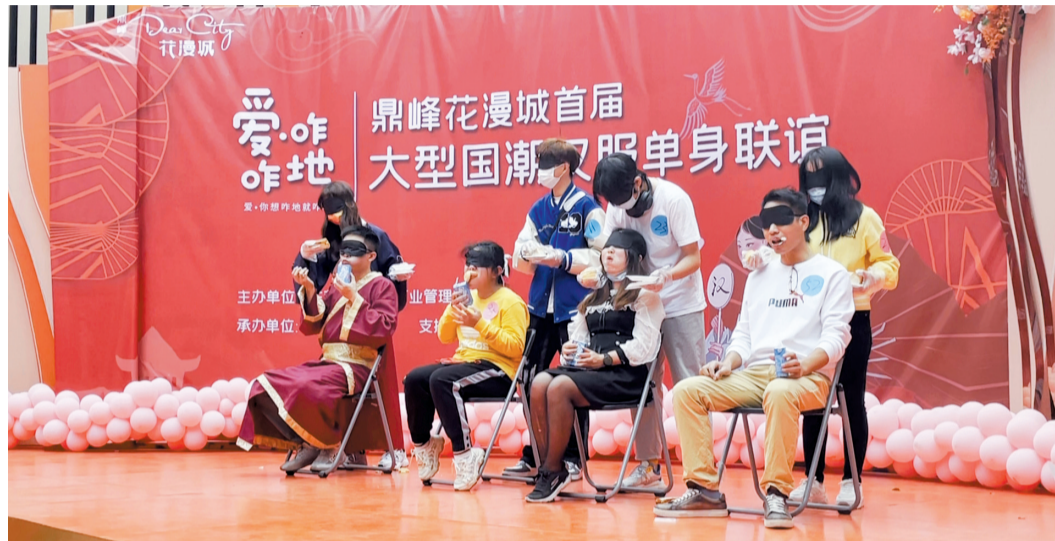
■线下相亲活动中，请“托儿”扮演和异性牵手成功。