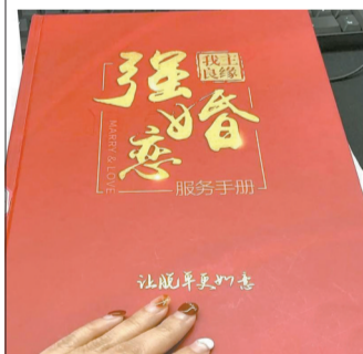
■“我主良缘”服务手册封面。