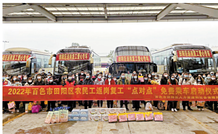
■爱心大巴将务工人员“点对点”送上就业岗位。

为助力企业复工复产,防控复工两手抓、两不误,田阳相关部门还定期深入东部企业走访调研,及时解决东部企业复工复产问题,协调相关部门研究解决果天下二期、深百情现代农业深加工和金晋农产品交易中心3个重大项目建设过程中涉及的排污、供电、融资、用地等困难和问题。截至目前,田阳区已深入企业走访调研5次,召开企业协调会5次,进一步推动企业顺利复工复产,实现年内投产达效。