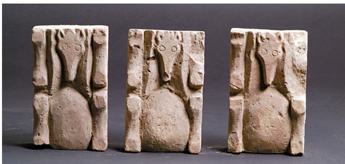
■熊踏蹂砖,甘肃省酒泉市下河清农场采集,甘肃省博物馆藏