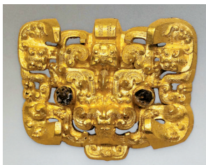
■战国晚期,高浮雕兽面纹金带扣,甘肃省文物考古研究所藏