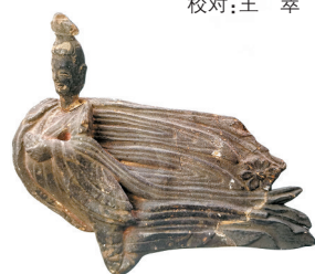
■北魏,影塑飞天,麦积山石窟第133窟出土,麦积山石窟艺术研究所藏