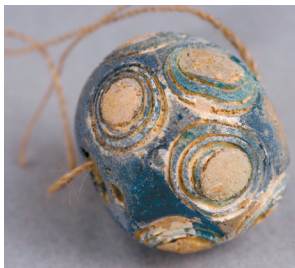
■战国,蜻蜓眼玻璃珠,甘肃省博物馆藏