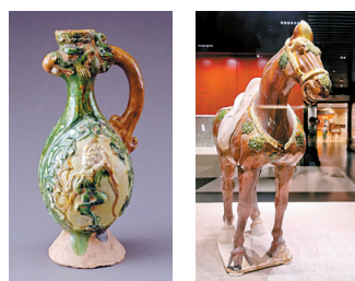
■三彩胡旋舞凤首壶 ■展览现场