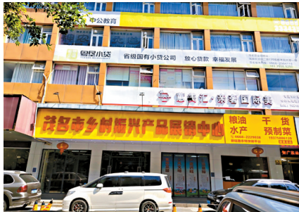
■位于茂名市区中心地段的茂名市乡村振兴产品展销中心。