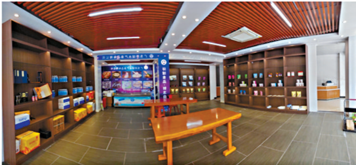
■野生红茶、木耳、香菇、蜂蜜、油米、特色瑶药等特优农产品和瑶脉山泉等金秀产品在茂名市乡村振兴产品展销中心展销。