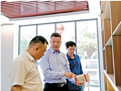
■茂南、电白区驻金秀县粤桂协作工作组组长、金秀县委常委、副县长肖华宏在茂名市乡村振兴产品展销中心对接消费帮扶工作。