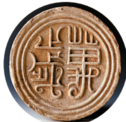
■南越国“万岁”文字瓦当