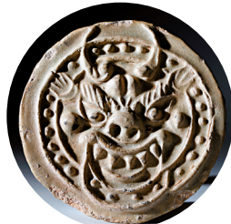
■南汉国 青釉兽面纹瓦当