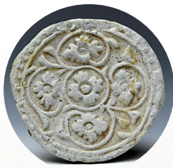
■宋代缠枝花卉纹瓦当