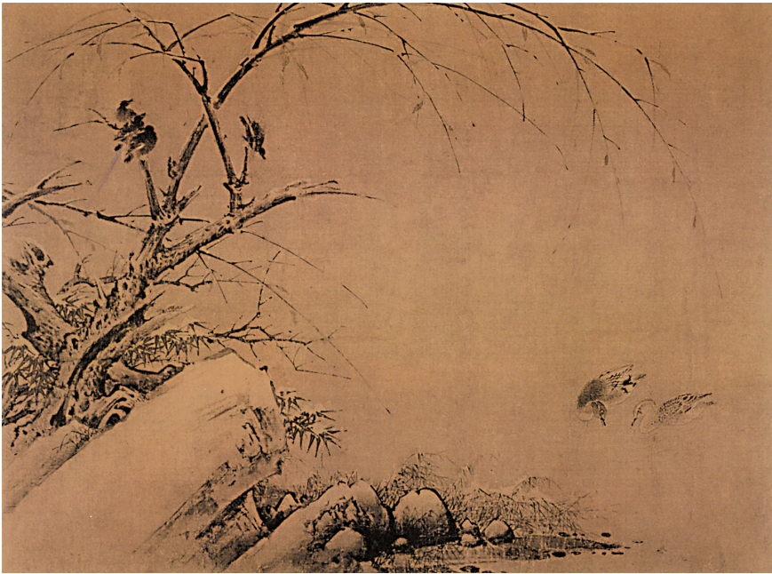
■宋代 黄筌 雪竹文禽图

宋伟光:对,十九世纪以后,尤其是印象派的出现,它显然是受了东方诗性表达的影响,它已经不重视客观的反映,不局限在眼前所见,而且绘画也已经不再依附