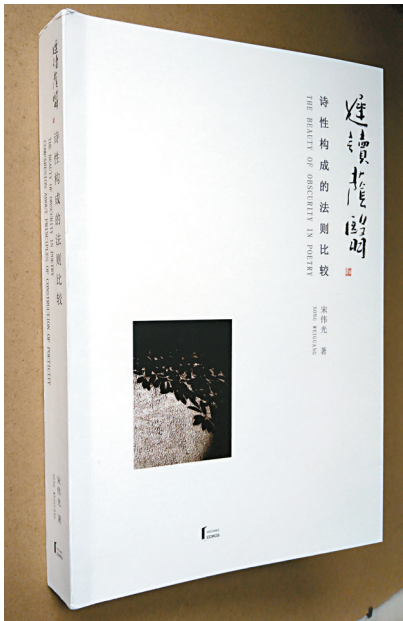
■《迟读荫翳——诗性构成的法则比较》封面

日前,著名学者宋伟光著作《迟读荫翳——诗性构成的法则比较》正式面世,这是一本关于诗性美学的专著,整本书近400页,大约三分之一是关于诗性构成的法则比较的理论探索。宋伟光接受收藏周刊专访时介绍,该论述最早是在三十年前就开始动笔,但过程时断时续,直到六年前才脱稿。谈及诗性构成,宋伟光认为,“艺术创作离不开诗性的浪漫。”