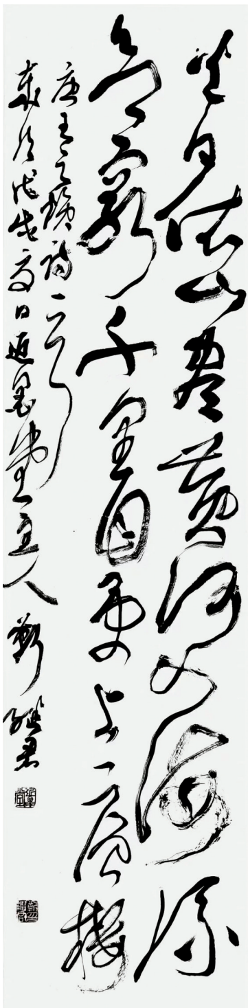
■靳继君草书《王之涣诗一首》

记得第一次跟靳继君教授相识,是在2017年他来东莞的一次讲座活动中。靳教授平易近人且幽默风趣,语言豪爽洒脱,对于我这位后学的提问给予热情解答。他以深入浅出的语言梳理了书法史上一些重要学术话题。比如“书画同源、书文同脉、书乐同归、书舞同势”,并讲到了苏东坡在贬谪生活中如何写出著名的《黄州寒食诗帖》,从作品内容及线条笔墨中分析苏东坡的内心世界,既苦闷又豁达。靳教授因人才引进从北方来到岭南,说明其早年在书法学术方面已经取得相当成就。