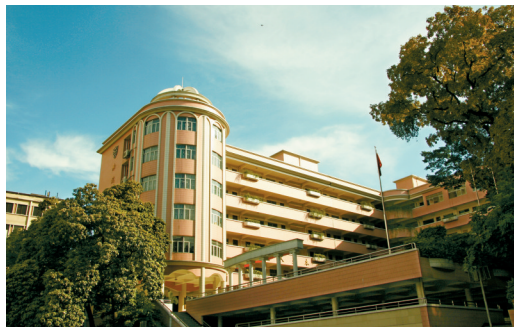
■广州市南武中学奉公楼。

另外,考生一定要深入了解目标学校的教育教学情况,建议考生和家长不能只看学校的宣讲,而是要去听听在校学生的感受和体验,这是非常重要的。