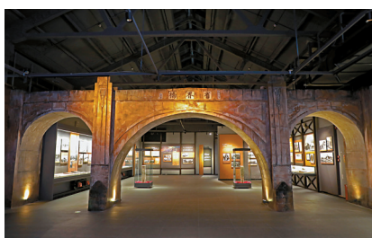
■按比例复建的省界桥。