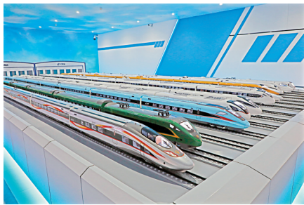
■博物馆展示的11种不同型号的动车。

据《广州史志》记载,这个广州南站始建于光绪二十七年(1901年),当时站名为黄沙站。1946年12月18日,黄沙站客运业务移到大沙头站后,改名广州南站。中华人民共和国成立后,广州南站除了办理货运及水陆联运外,还兼办粤汉铁路的列车编组。1970年,编组任务移到广州北站,该站成为了一个纯货运站。到上世纪90年代,该站一度成长为华南地区最大的水陆兼备、站港合一的特等大型货运站。2005年,残旧货运站场已经跟不上城市面貌的更新,原本的城市郊区也变身为市中心繁华地带,考虑到多方面因素,老广州南站在2005年6月10日正式关闭。之后的车站地块进行改造开发,保留沿江的车站建筑用作建设铁路博物馆。