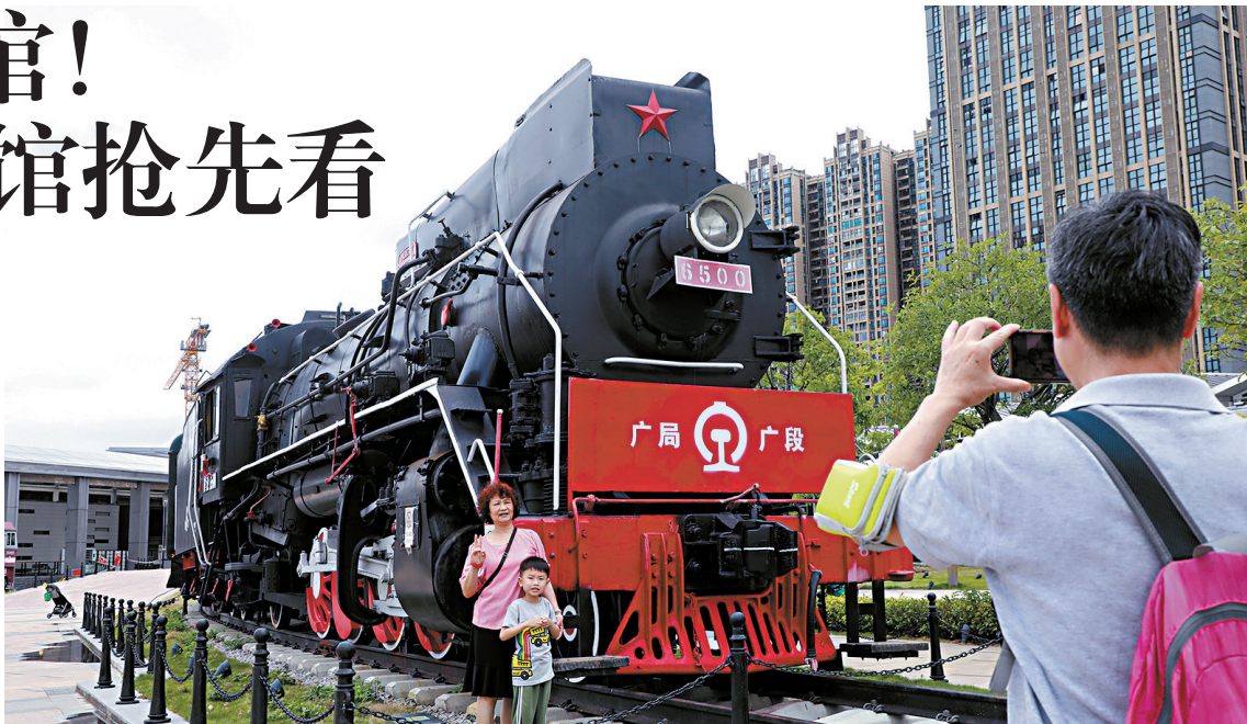
■广州铁路博物馆露天展区的建设型蒸汽机车。