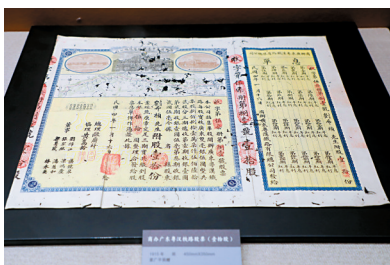
■广东粤汉铁路股票。

广州铁路博物馆的室内展馆内集陈列、收藏、展示、科普、教育于一体,现有藏品2000余件。博物馆分为两个展馆和一个露天展区,占地面积28590平方米。两个展馆都是以前的火车旧货仓,属于广州市历史建筑“粤汉铁路黄沙车站旧址”。一号馆由5个展厅组成,展出广州铁路百年历史。二号馆展出铁路工业遗产和铁路老物件。露天展区主要展示部分机车、车辆、线路、信号等铁路设备。目前博物馆尚未开放,但露天展区已经可以供市民参观和拍照留念。