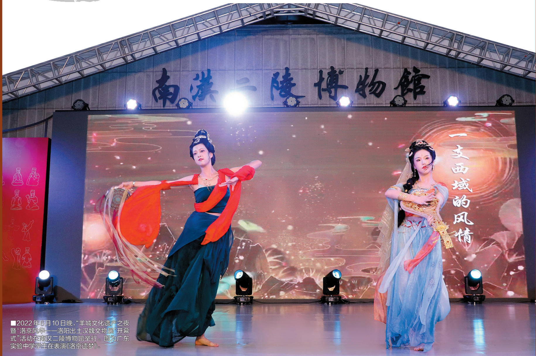
■2022年6月10日晚,“羊城文化遗产之夜暨‘洛京风华——洛阳出土汉魏文物展’开幕式”活动在南汉二陵博物馆举行。图为广东实验中学学生在表演《洛京遗梦》。