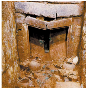
■西汉南越国遗迹 (南越文王墓)

当我们说起文化遗产的守护与活化,我们就已把自身,投入了源远流长的璀璨文明之河,上下求索,共同跋涉。