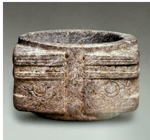
■石峡文化随葬玉琮。