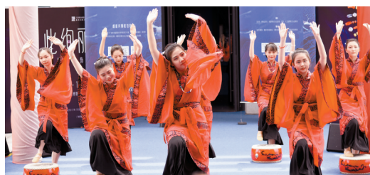
■“只此绚丽——广州出土汉代珠饰展”开幕式现场的《相和歌》盘鼓舞表演。