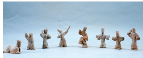
■陶舞俑,洛京风华——洛阳出土汉魏文物展展品