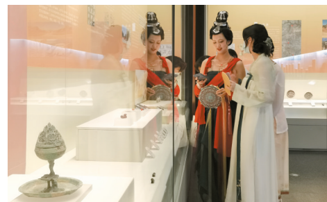
■“洛京风华——洛阳出土汉魏文物展”现场。