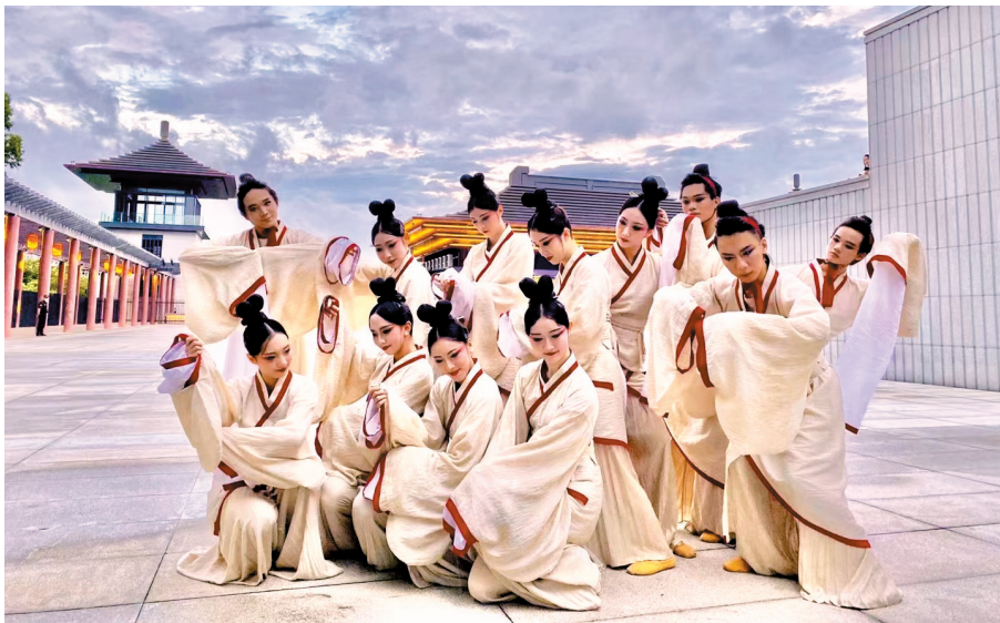
■《皓月》舞者在南汉二陵博物馆广场上合照

今年6月11日是文化和自然遗产日,活动主题为“文物保护:时代共进 人民共享”。记者获悉,广州市文物部门在6月组织开展了“文化和自然遗产日”系列宣传活动,倾力打造文化遗产宣传月活动,用文化遗产保护成果丰富全社会历史文化滋养,助力广州实现老城市新活力、城市文化综合实力出新出彩。其中,6月10日晚,“羊城文化遗产之夜暨‘洛京风华——洛阳出土汉魏文物展’开幕式”活动在南汉二陵博物馆举行,掀起系列宣传活动的高潮。