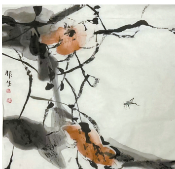
■魏根生《虫草系列作品之四》

近日,由艺咖文化主办,恒逸艺术馆、渔歌晚唱艺术沙龙共同协办的“造境”魏根生作品展在恒逸艺术馆揭幕。本次展览精选了魏根生先生近年创作并亲自挑选的60件小幅精品,画作尺幅不大,却张张透露着作者的精巧构思和以小见大的艺术主张。