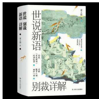
■董上德《世说新语别裁详解》

据介绍,书中的每一条释读以及每一个人物全部故事之后的“编选者言”,均试图亦文亦史,文史结合,以期知人论世。尤其值得一提的是,本书几乎在每一篇章中,都配上了人物插图,增强了本书的阅读趣味,而且人物造型古朴,笔墨精到,为读者增添了阅读的视觉享受。(梁志钦)